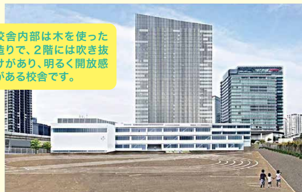
※完成予想図。実際とは壁の色などが異なります。

校舎内部は木を使った造りで、2階には吹き抜けがあり、明るく開放感がある校舎です。